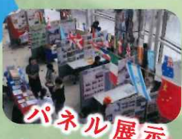
パネル展示 姉妹・友好都市、 JICA北陸、ベトナム カナダなどの紹介

2024年11月4日 Monday observed holiday 11:00~15:00