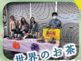
世界のお茶 英国紅茶、コーヒンティー、 中国茶、ロシアンティー、 お抹茶