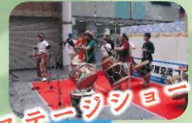
ステージショー 中国の踊り、ジョンショー、 世界のダンス、音楽など ベリーの音楽など ブラジルの音楽など