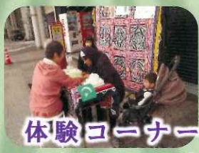
体験コーナー ヘナタトゥー、バルーン アート、射的など