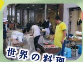
世界の料理 中国水餃子、ととまる、 ブラジル料理、 ベトナムフォー、 パキスタンカレー、 etc.